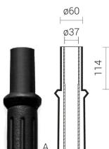
тип окончания „А” – Ø60

F - повышенной термической стойкости – для опор, предназначенных для использования в регионах, где температура воздуха ниже чем -30°C, а также превышает +40°C. Это касается опор чёрного цвета.