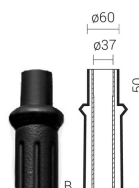
тип окончания „В” – Ø60

системы консолей типа "P" оголовники WT, WA-1, WA-01, WA-4