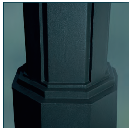
(illustrations ci-dessus : peinture givrée)

Saillie au point de fixation du luminaire : 1,50 m.