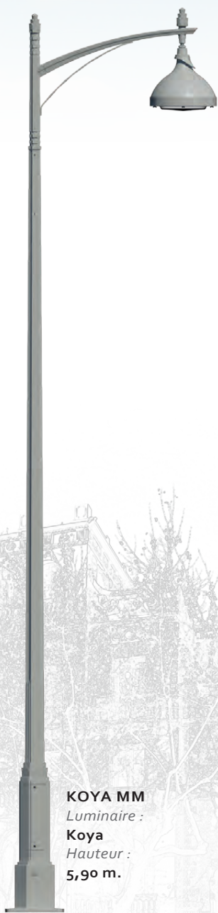
KOYA MM Luminaire : Koya Hauteur : 5,90 m.